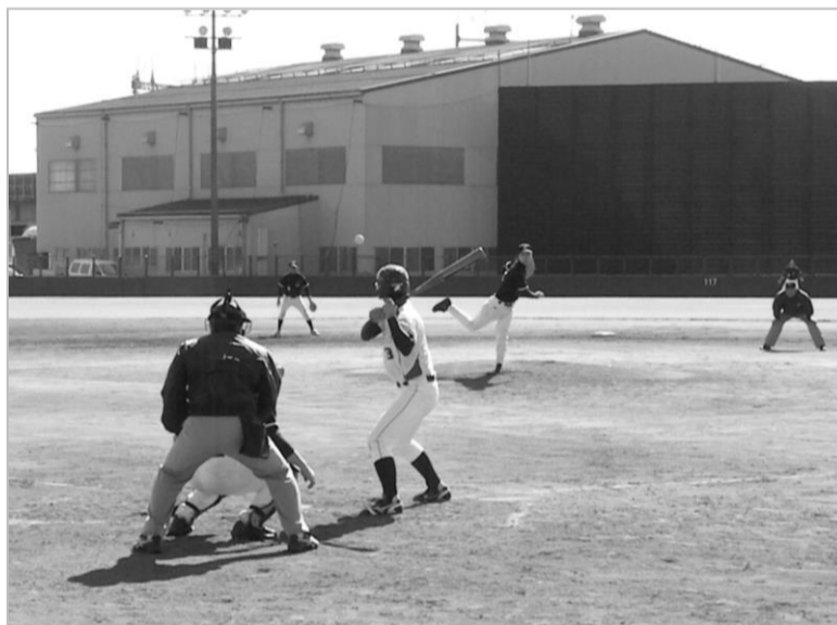
開幕試合は前回覇者・関東 VS エクスプレスの試合。緊迫した投手戦となり、観客も手に汗を握る好ゲームとなった。

試合は、初出場のセイノースーパーエクスプレスが初勝利を挙げる一方で、前回覇者の関東が初戦で敗れるという波乱もある中、強豪の軟式野球チームを有する濃飛西濃と、前回準優勝の北海道西濃が決勝戦へ進出しました。